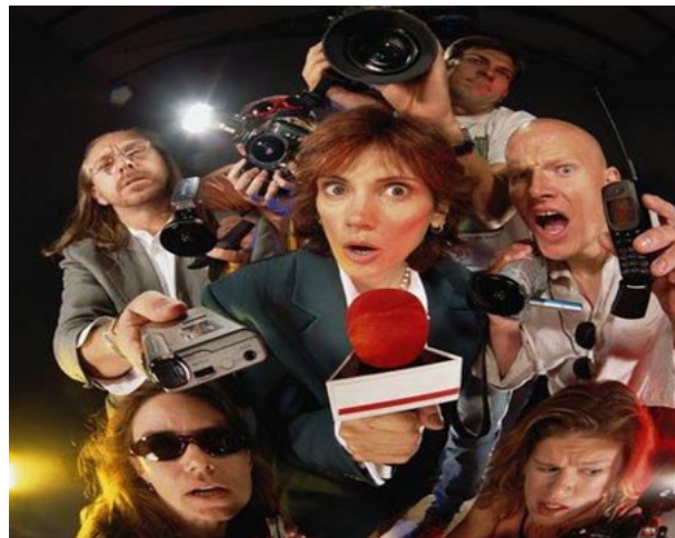
Figura 5 – A razão no Jornalismo