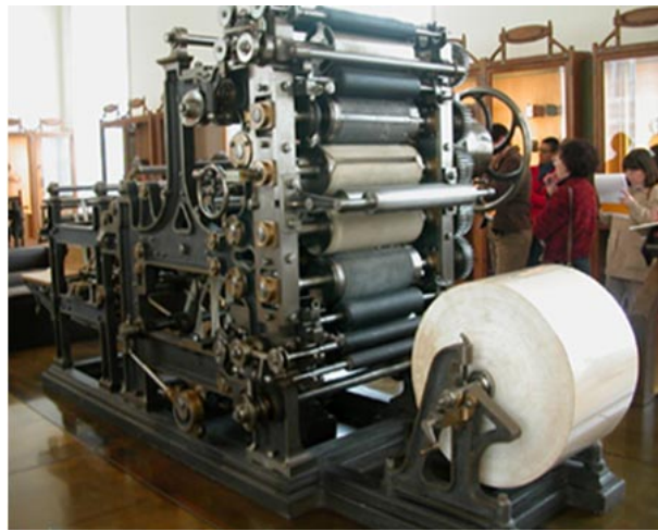
Figura 3 – Impressora de Marinoni.