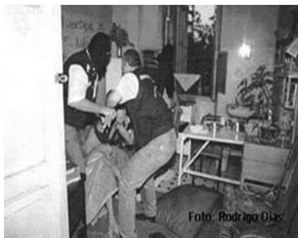
Figura 2 – Policiais tentam tirar pessoa de barraco à força.