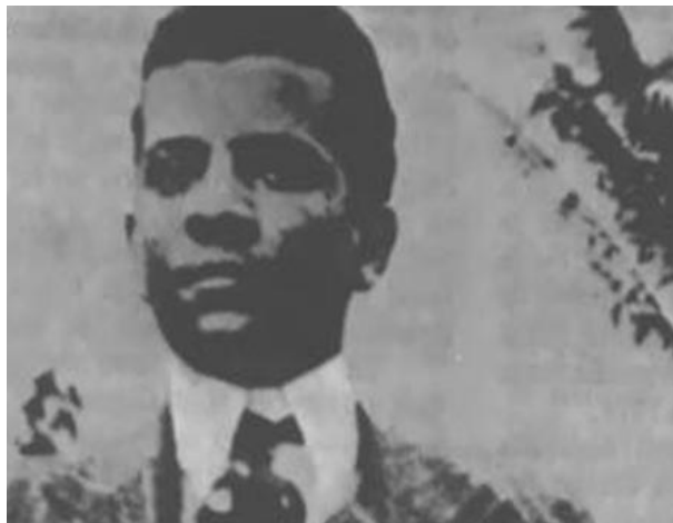
Figura 6 – Lima Barreto