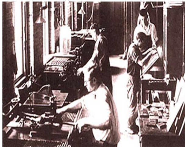
Figura 4 – Oficina de impressão de jornal no século XIX.